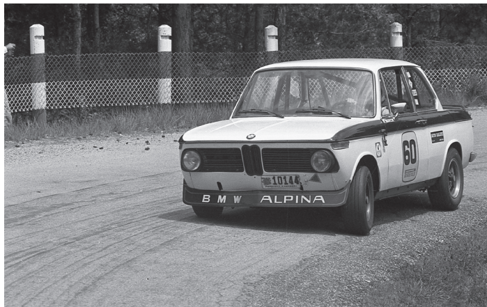
Ramon March (BMW 2002 Ti), 1975